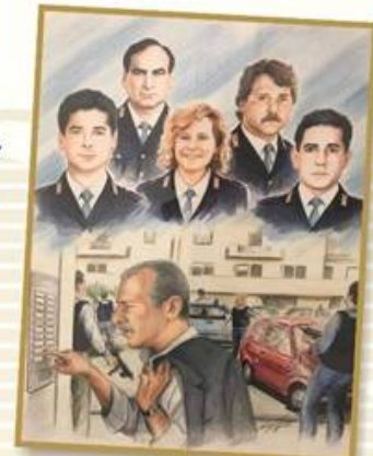
19 luglio 1992

Parlamento della Legalità Internazionale