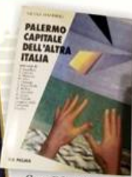
Casa Editrice IL PALMA 1991

"Vedi Giudice, hanno distrutto strade, autostrade, palazzi, ma non hanno ancora inventato una bomba che distrugga l'amore. Non mollare, mai!"