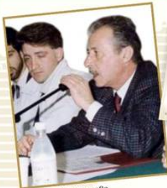
Palermo, 18 marzo 1989